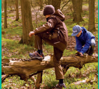
Wald als Therapiehelfer