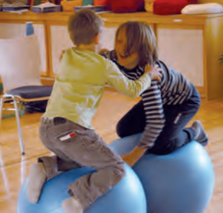
Körpertherapie, mit Ball